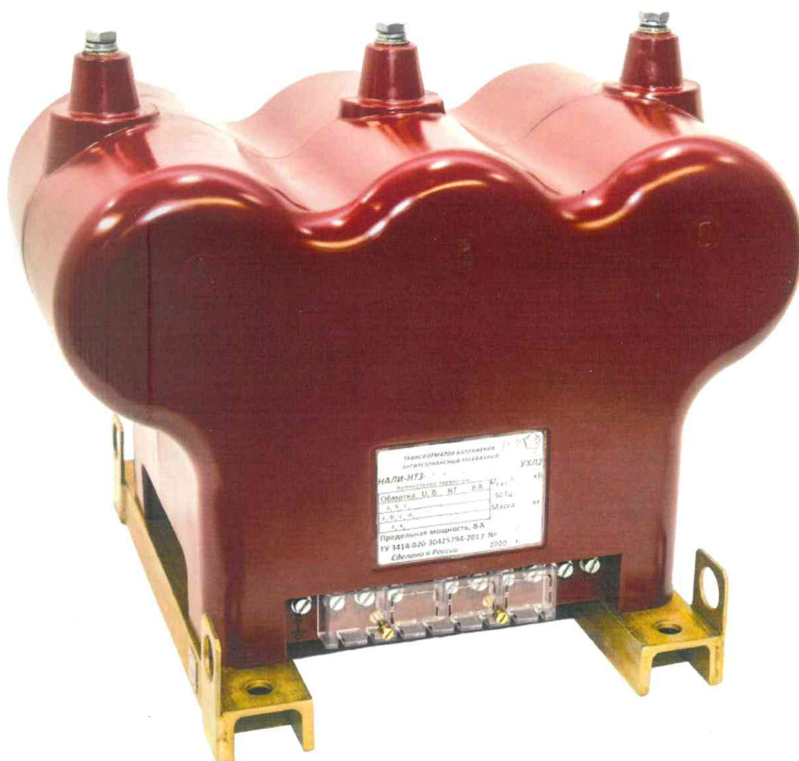
Рисунок 1 – Общий вид трансформаторов напряжения антирезонансных трехфазных НАЛИ-НТЗ-6(10)

Трансформаторы относятся к не ремонтируемым и не восстанавливаемым изделиям. Допускается замена предохранительных устройств в случае их срабатывания.