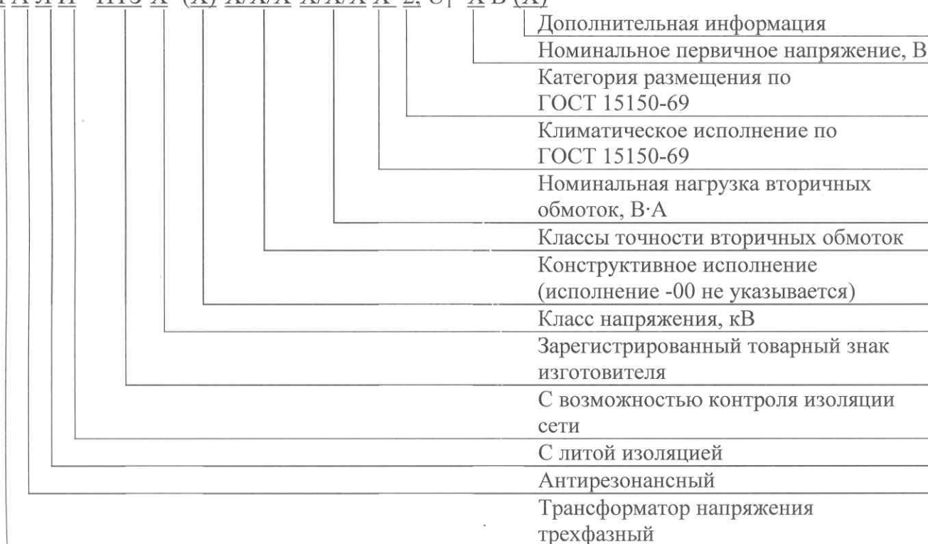
Рисунок 4 – Структура условного обозначения трансформаторов напряжения НАЛИ-НТЗ

НАЛИ - НТЗ-Х -(Х)-Х/Х/Х-Х/Х/Х Х 2, U 1 =Х В (Х)