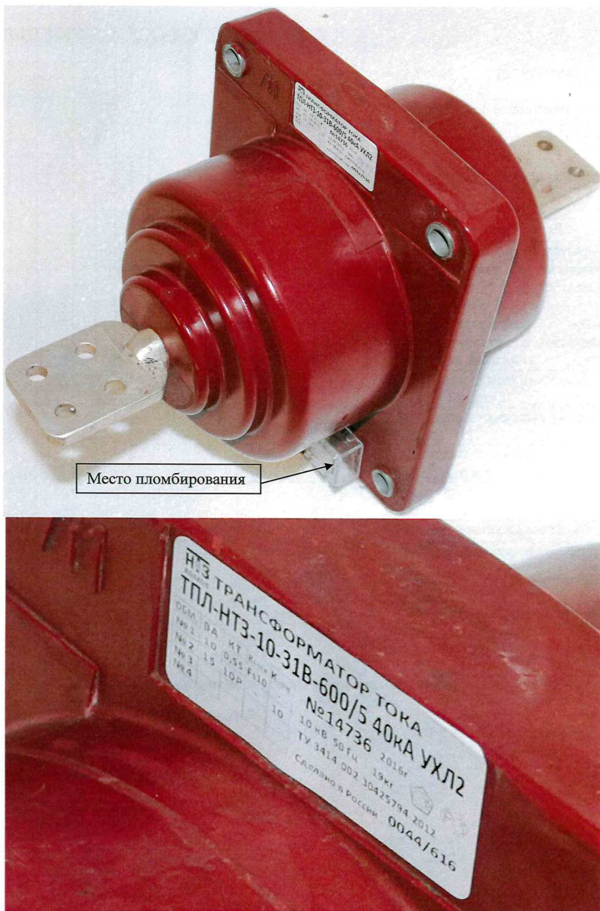
Рисунок 1 - Общий вид трансформаторов тока ТПЛ-НТЗ