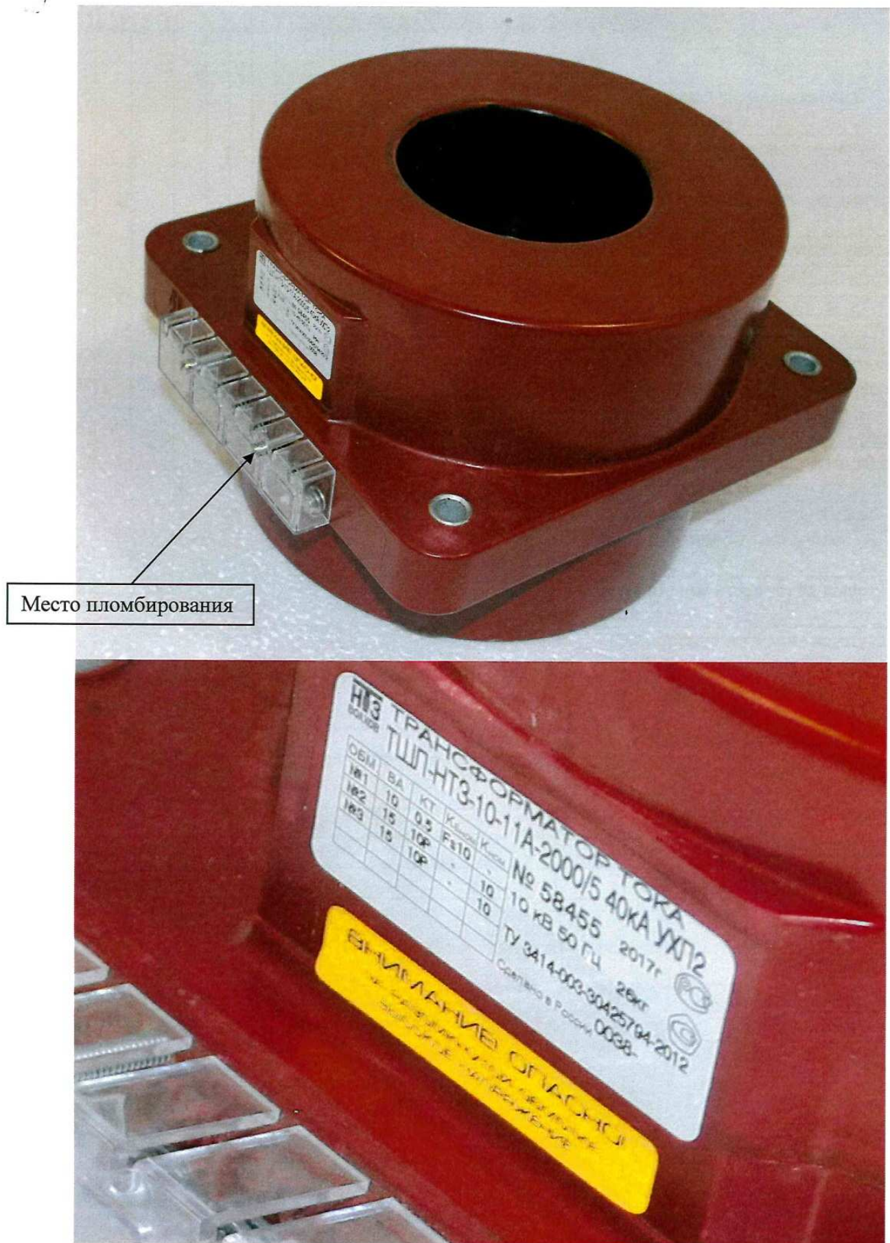
Рисунок 1 - Общий вид трансформаторов тока ТШЛ-НТЗ